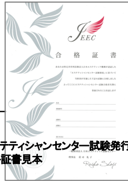
エステティシャンセンター試験発行 合格証書見本