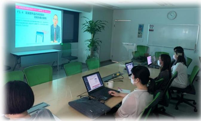
「薬機法セミナー参加」

また、エステティック業に関連する特定商取引法や消費者契約法、景品表示法や薬機法などの専門知識の向上に必要な勉強会などへの参加も積極的に行っています。