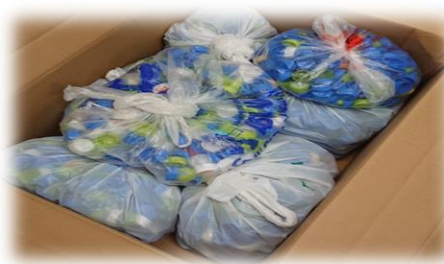
回収したペットボトルキャップ

※非出推価格・石油量・原油価格の換算について 価格の変動が多いため、換算値の計算が難しいので、今回からは表示しておりません。 申し訳ございませんが、ご了承下さい。