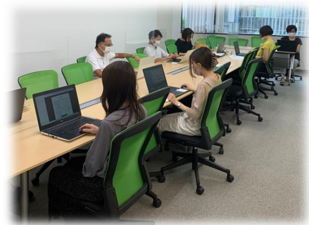
「事務局ミーティング」

各自の業務進捗状況や連絡事項などを発表する情報共有の場を月に2回以上設け、従業員全員で積極的な意見交換をしています。