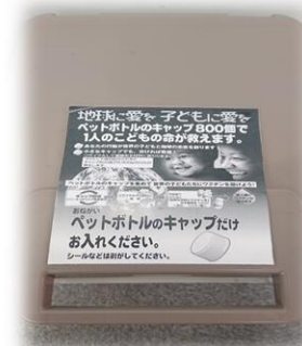
ペットボトルキャップ回収専用BOX